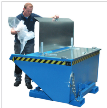
EXPO mit Deckel