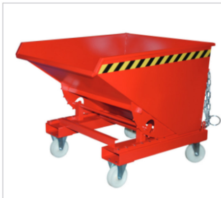
EXPO mit Rollen