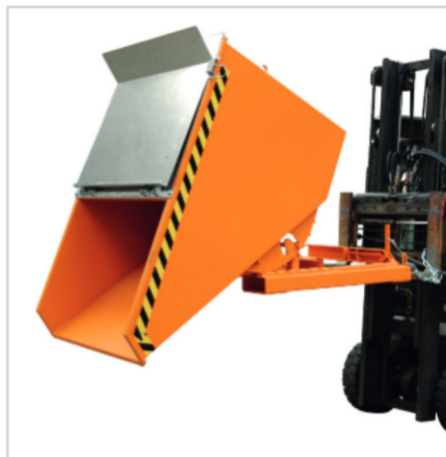
EXPO mit Deckel